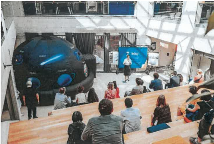
susreću stručnjaci na tom području.

Sam kraj mjeseca obilježila je promocija polaznika treće Trokut NEET Akademije – data science, edukacijskog programa za prekvalifikaciju mladih. Program je započeo u jesen 2022., a polaznici su prošli kroz intenzivnih šest mjeseci teorijskog i praktičnog rada tijekom kojih su se specijalizirali za pomoć tvrtkama u razvoju podatkovnih ekosustava. Za cilj je postavljeno da polaznici ne samo nauče nove vještine, već i vide probleme s kojima se svakodnevno